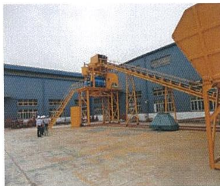
ベルトコンベヤー(工場内作動テスト)