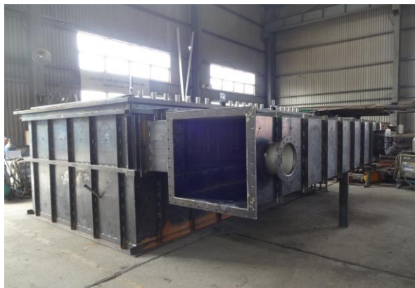
バグフィルター(上部)