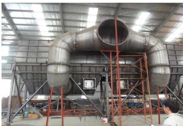
バグフィルター(下部)