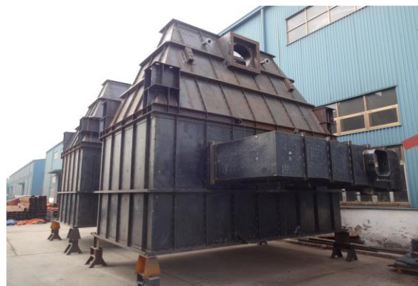
バグフィルター(上部)