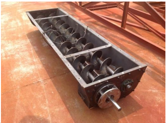
スクリー式排出装置