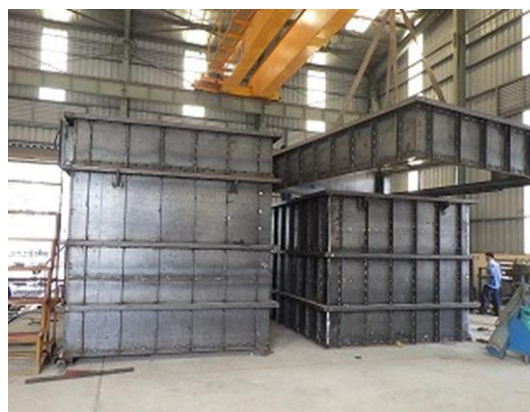
バグフィルター(中間ケース)