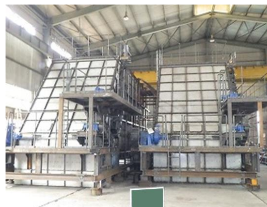
排出フィーダー(仮組試運転)