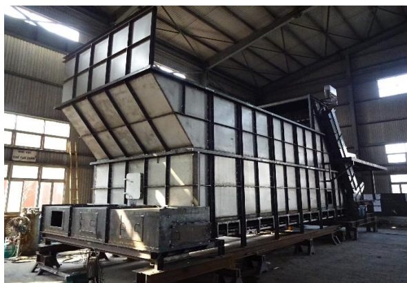
排出フィーダー(仮組試運転)